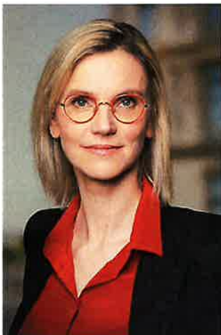
Agnès Pannier-Runacher, ministre de la Transition énergétique